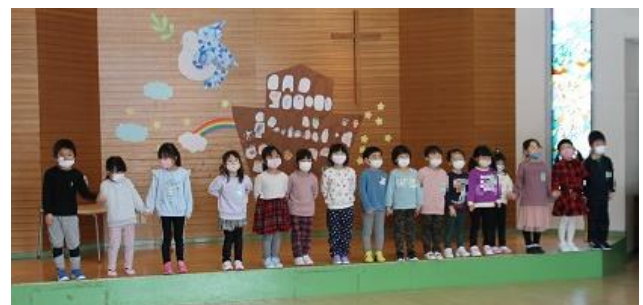
3月の年長さんのお別れ会でがんばった今年の「年長さん（はと組）」です！

昨年度は、「いつもであれば」とか「例年ならば」という言葉を何度も使ってきました。しかし、これからはコロナ禍を踏まえて、新たな保育や行事を考え、行っていかななくてはと思います。これから始まる1年間、職員一同も精いっぱいの努力をしております。保護者の皆様におかれましても、ご理解とご協力を賜りたいと思います。今年度も、どうぞよろしくお願い申し上げます。